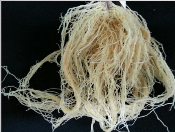
은 이온수로 재배한 토마토의 뿌리

일반 물과 당사의 은 이온수로 재배한 토마토에 뿌리혹선충을 감염 시킨 결과 일반 물로 재배한 토마토에 뿌리혹선충의 피해가 나타난 반면 당사의 은 이온수로 재배한 토마토에선 뿌리혹선충의 피해가 발생하지 않았다.