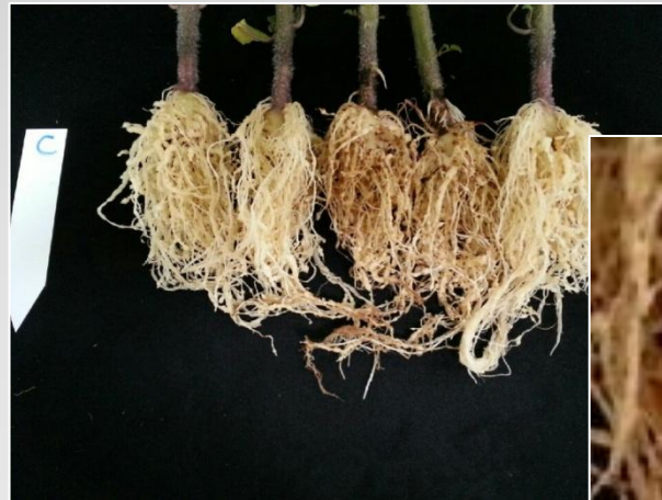
일반 물 재배한 토마토의 뿌리